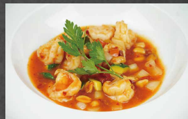
230 - GAMBERI PICCANTI