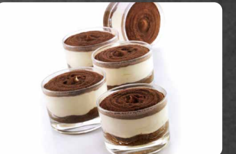
282 - COPPA TIRAMISU 5.00€