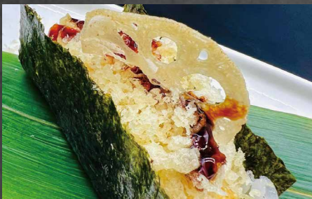
088 - TEMAKI EBITEN gamberi in tempura, riso, avocado, alghe, salsa teriyaki 🌾🐟🥬