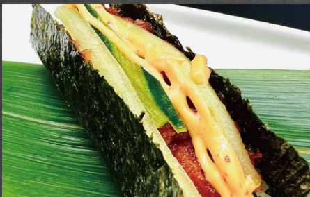
090 - TEMAKI SPICY TUNA spicy tonno, riso, alghe 🌶️🐟