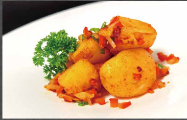
241 - PATATE SALE E PEPE verdura, uova, cipollina, piccante, burro