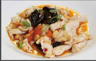
237 - POLLO PICCANTE verdura, piccante