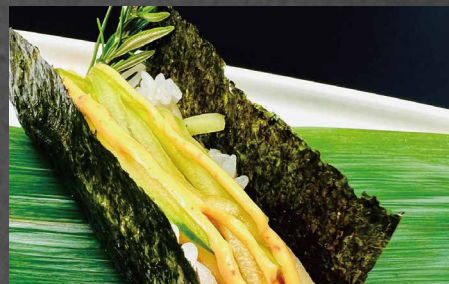
089 - TEMAKI SPICY SAKE spicy salmon, riso, alghe 🌶️🐟