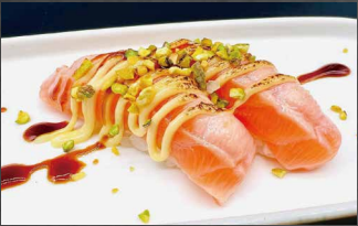
009 - NIGIRI SAKÉ FLAMBE salmone, riso, salsa chizu, teriyaki 🍣 🍷 🌿 🍃