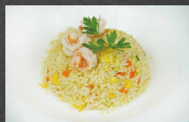
210 - RISO GAMBERI riso, verdure, uova gamberi, salsa, cipollina, burro