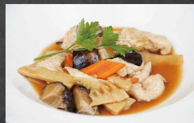
234 - POLLO FUNGHI E BAMBU