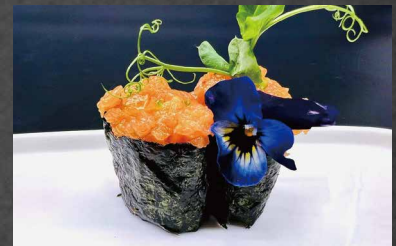
016 - GUNKAN SAKÉ spicy salmone, alghe, riso, uova di pesce 🍣