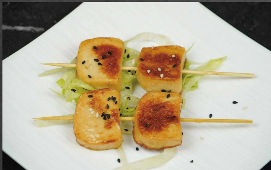
266 - TOUFU SPIEDINI tou fu, salsa teriyaki