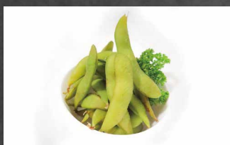
203 - EDAMAME fagioli