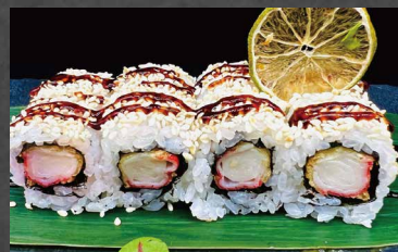
121 - URAMAKI KANI surimi fritto, sesamo, riso, alghe, salsa teriyaki