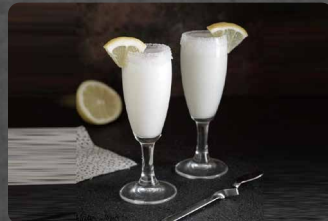
281 - SORBETTO AL LIMONE 5.50€