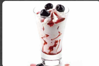
277 - COPPA SPAGNOLA 5.00€