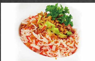
073 - POKE CALIFORNIA surimi, riso, avocado, tobiko, maionese, cipolla croccante, salsa sesamo 🌿🍷🍷