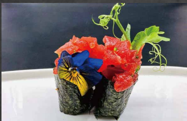
017 - GUNKAN MAGURO spicy tonno, alghe, riso, uova di pesce 🍣 🍣