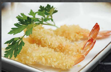
250 - TEMPURA GAMBERI gamberi, farina 🌾 🍷