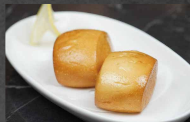
245 - PANE FRITTO pane, farina 🍷