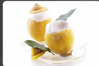
280 - LIMONE RIPIENO 4.50€