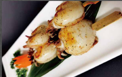
264 - SPIEDINI DI SEPPIE calamaro, teriyaki