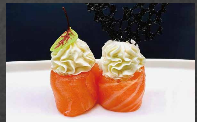
019 - GUNKAN PHILADELPHIA salmone, riso, philadelphia, uova di pesce 🍣 🍷