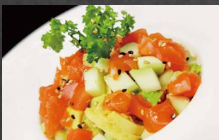
071 - POKE SAKE salmone, riso, avocado, cetriolo, sesamo, salsa frutta 🐟🌿🍷