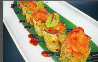
068 - HOSOMAKI SPICY salmone spicy, avocado, riso, alghe, salsa teriyaki, pastella fritto 🍷🐟🌿 (6pz)