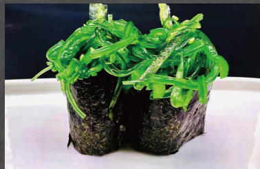
015 - GUNKAN WAKAME wakame, riso, alghe 🍣