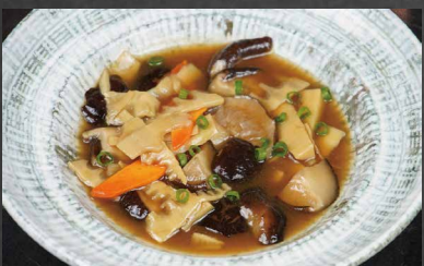
232 - BAMBU E FUNGHI