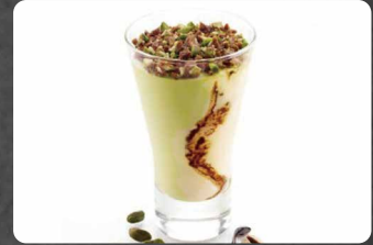
276 - COPPA CREMA PISTACCHIO 5.00€