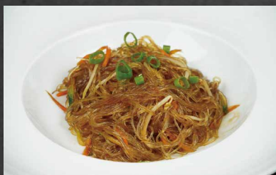
213 - SPAGHETTI DI SOIA CON VERDURE