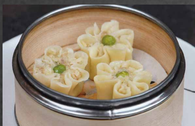
255 - SHAO MAI gamberi, farina 🌾 🍷