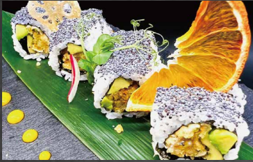
109 - URAMAKI VEGETAL avocado, cetriolo, carote, sesamo, alghe, riso