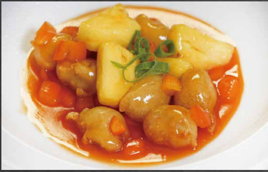
240 - MAIALE SALSA AGRODOLCE ananas, peperoni