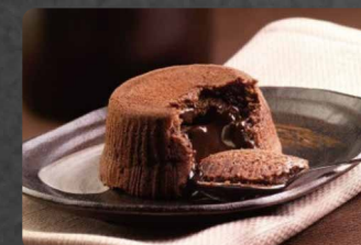
283 - SOUFFLE AL CIOCCOLATO 5.00€