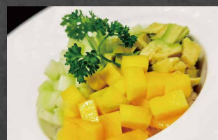
074 - POKE VEGETAL avocado, riso, mango, cetriolo, salsa di frutta 🌿