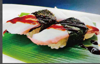
006 - NIGIRI TAKO polpo, riso, salsa teriyaki 🍣