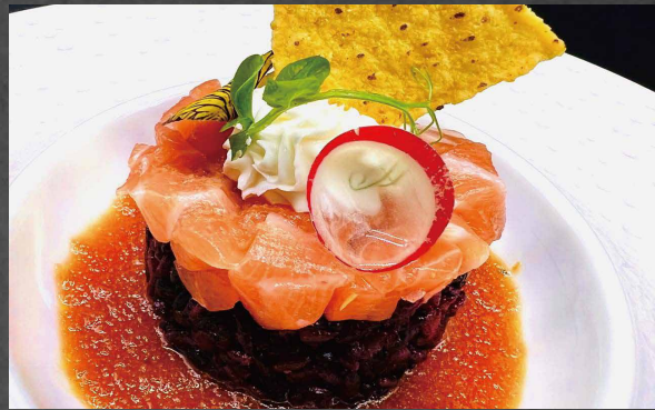
032 - TARTARE BLANK riso venere, philadelphia, salmone, salsa fruttato 🌊 🥬 🍷