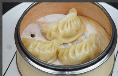
257 - RAVIOLI DI CARNE AL VAPORE carne farina 🌾