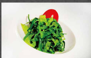
204 - GOMA WAKAME alghe, sesamo