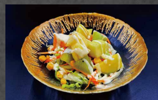
206 - INSALATA CON FRUTTA frutta mista, insalata