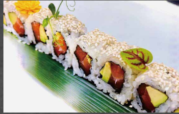
110 - URAMAKI SAKE salmone, avocado, riso, maionese, sesamo, alghe