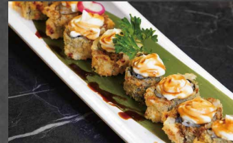
069 - HOSOMAKI FRITTO riso, alghe, salmone, philadelphia, salsa teriyaki 🐟🌿🍷