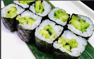
067 - HOSOMAKI CETRIOLO cetriolo, riso, alghe (8pz)