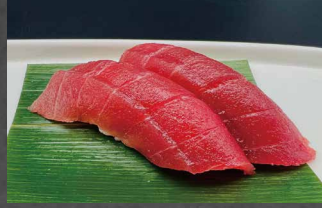
002 - NIGIRI MAGURO tonno, riso 🍣