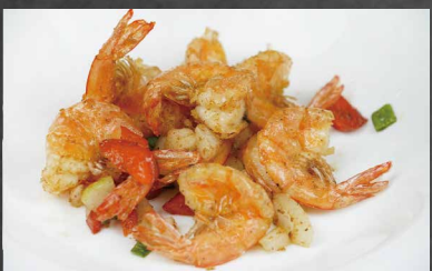
225 - GAMBERI CON SALE E PEPE