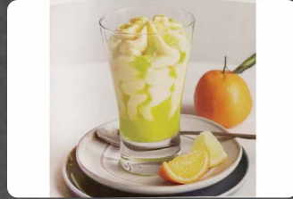
275 - COPPA ISABEL 5.50€