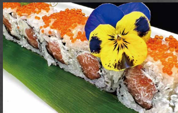
113 - URAMAKI PHILADELPHIA salmone, philadelphia, tobiko, riso, alghe