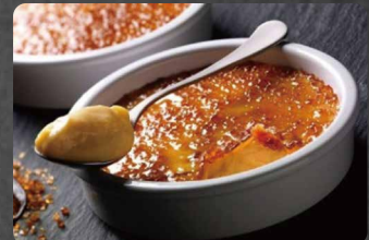
279 - CREMA CATALANA IN COCCO 5.50€