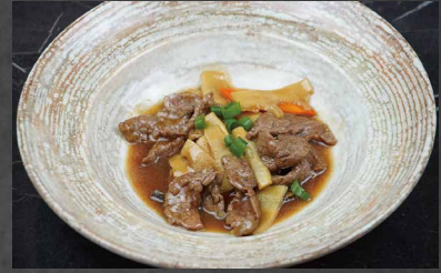
238 - MANZO BAMBU FUNGHI funghi, bambù