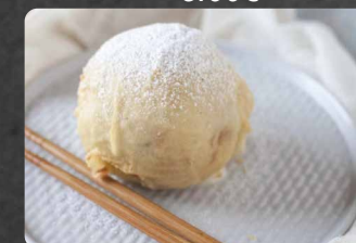
286 - GELATO FRITTO 4.50€