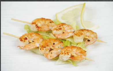
262 - SPIEDINI DI GAMBERI gamberi, teriyaki