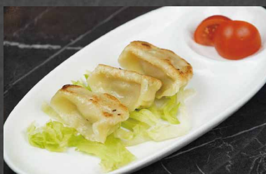
260 - RAVIOLI DI CARNE ALLA GRIGLIA carne farina 🌾