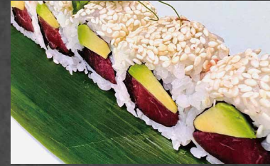
111 - URAMAKI TUNA tonno, avocado, riso, maionese, sesamo, alghe