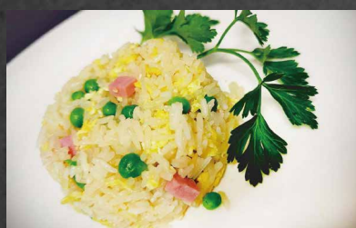
208 - RISO CANTONESE prosciutto cotto, piselli, uova