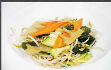
233 - VERDURE SALTATE