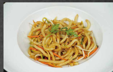
216 - UDON SALTATO CON VERDURE