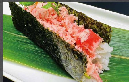
091 - TEMAKI CALIFORNIA surimi, avocado, riso, alghe, maionese 🌾🥚