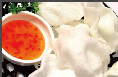
243 - NUVOLETTE DI DRAGO gamberi, fecola di patate 🍷