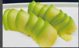
007 - NIGIRI AVOCADO avocado, alghe, riso