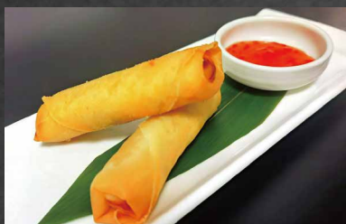
242 - INVOLTINI PRIMAVERA verdura, farina 🌾