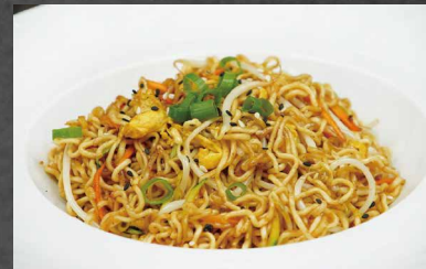
222 - SALTATI NOODLES

verdura, uova, cipollina, piccante, burro