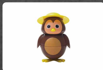
284 - CIP CIOK 3.50€