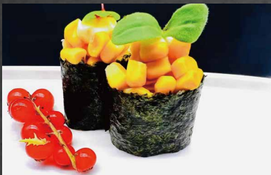
014 - GUNKAN MAIS mais, alghe, maionese, riso 🍣