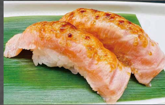
010 - NIGIRI CAMEL salmone, riso, zucchero caramellato 🍣