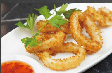
246 - CALAMARI FRITTI calamari, farina 🍷 🍷