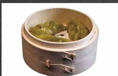
259 - RAVIOLI DI VERDURE AL VAPORE 🌾 verdure, farina