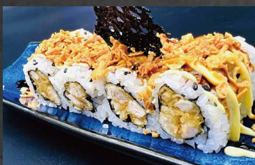
128 - URAMAKI CHICKEN pollo fritto, maionese, cipolla, salsa teriyaki, alghe, riso