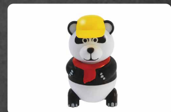
285 - PAN DAN 3.50€