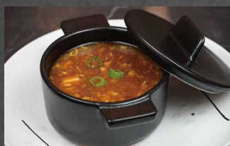
201 - ZUPPA AGROPICCANTE