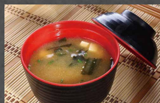
202 - ZUPPA DI MISO soia, alghe, tofu, cipollina