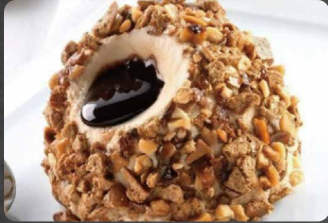
274 - TARTUFO NOCCIOLA 5.00€