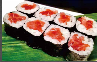
065 - HOSOMAKI TUNA tonno, riso, alghe 🐟🌿 (8pz)