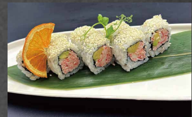
115 - URAMAKI CALIFORNIA surimi, avocado, riso, alghe, maionese, sesamo