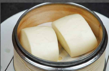
256 - PANE VAPORE pane, farina 🌾