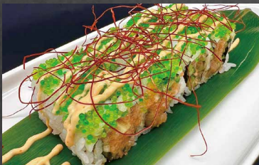
116 - URAMAKI SPICY SALMONE salmone, cetriolo, riso, alghe, tobiko, salsa spicy