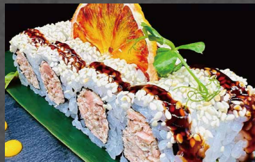
114 - URAMAKI SAKE COTTO salmone cotto, sesamo, salsa teriyaki