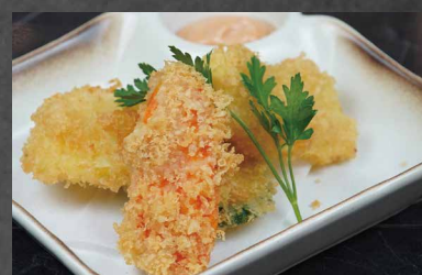
249 - TEMPURA VERDURE verdure misto, farina 🌾