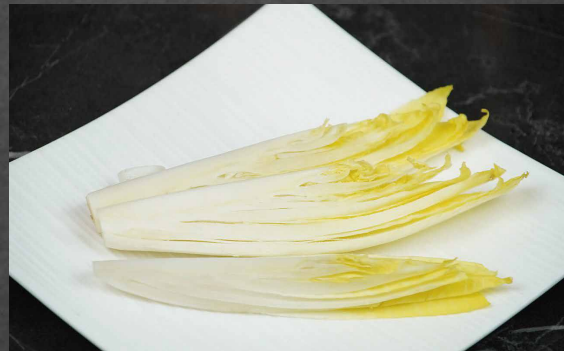
267 - VERDURA OLANDESE verdura