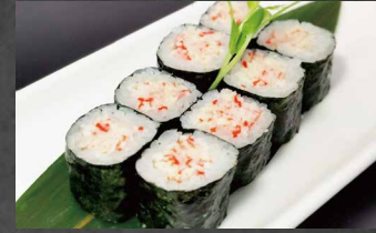
066 - HOSOMAKI SURIMI surimi, riso, alghe 🌿🍷 (8pz)