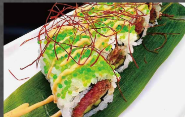
117 - URAMAKI SPICY TUNA tonno, cetriolo, riso, alghe, tobiko, salsa spicy