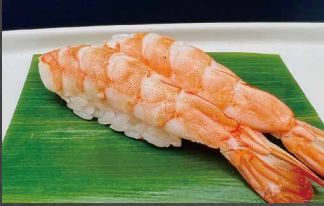
004 - NIGIRI EBI gamberi, riso 🍣