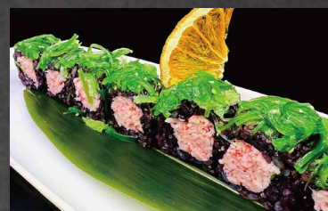
137 - URAMAKI BLACK CALIFORNIA surimi, riso venere, wakame, alghe