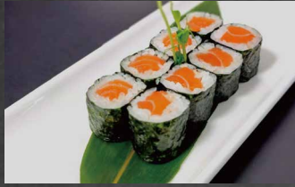
064 - HOSOMAKI SAKE salmone, riso, alghe 🐟🌿 (8pz)