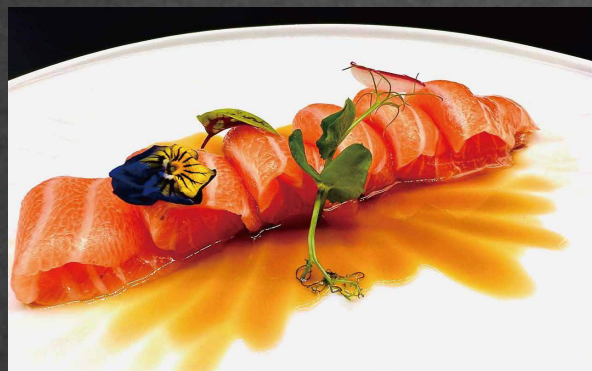
035 - CARPACCIO SALMONE salmone, salsa ponzu 🌊 🥬 (6pz) [Limite 1 volta ogni persona]