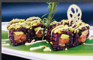
134 - URAMAKI BLACK SAKE salmone, avocado, riso venere, alghe, pistacchio, salsa rucola