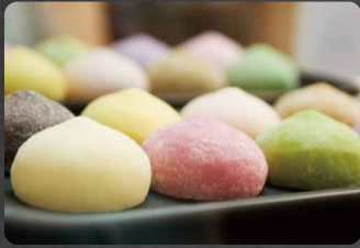
271 - MOCHI TE VERDE 4.00€