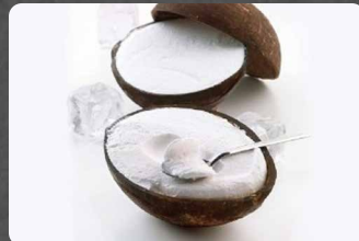
278 - COCCO RIPIENO 5.00€