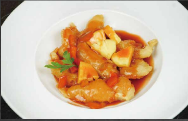
235 - POLLO AGRODOLCE ananas, peperoni