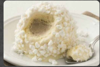
272 - TARTUFO BIANCO 5.00€