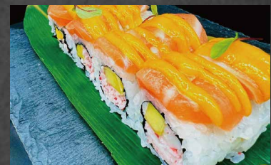
124 - MANGO ROLL surimi, riso, salmone, salsa di mango