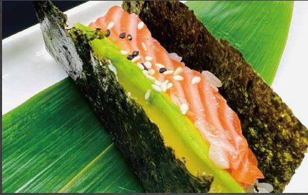
086 - TEMAKI SAKE salmon, avocado, riso, alghe, sesamo 🐟