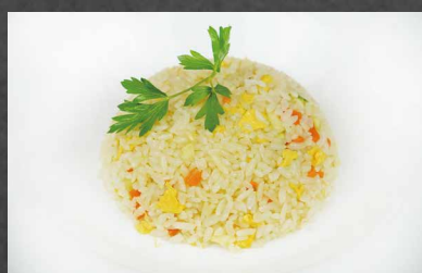
209 - RISO VERDURE riso, verdure, uova, salsa, cipollina, burro