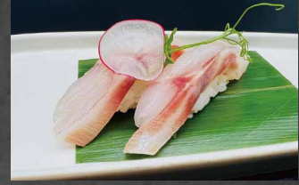
003 - NIGIRI SUZUKI branzino, riso 🍣