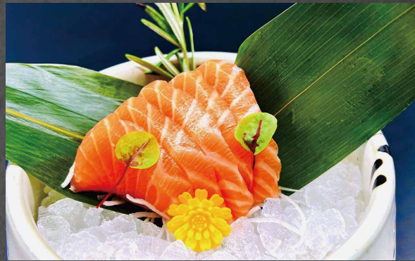
045 - SASHIMI SAKE salmone (5pz) 🌊 [Limite 1 volta ogni persona]