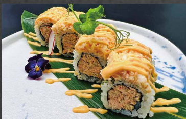
120 - URAMAKI SPECIAL EBI salmone cotto, prezzemollo, riso, gamberi, salsa cocktail, alghe