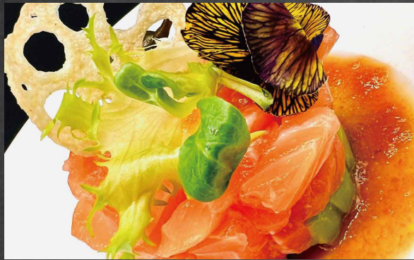
030 - TARTARE SAKE 🌊 🥬 salmone, avocado, salsa ponzu [Limite 1 volta ogni persona]