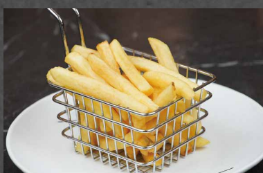
248 - PATATINE FRITTE patate