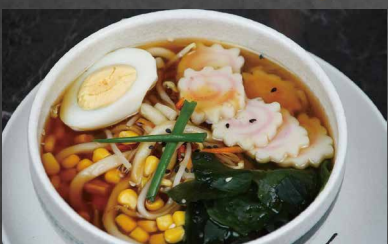
223 - RAMEN CON VERDURE

verdura, uova, mais, alghe, surimi, cipollina