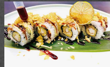
118 - URAMAKI EBITEN tempura di gamberi, chips, riso, maionese, salsa teriyaki, alghe, sesamo