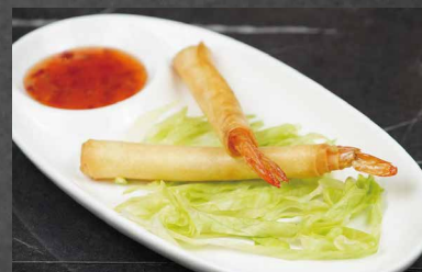
253 - INVOLTINI GAMBERI gamberi, farina 🌾 🍷