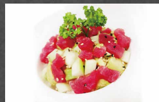
072 - POKE MAGURO tonno, riso, avocado, sesamo, salsa maionese piccante 🐟🌿🍷🍷