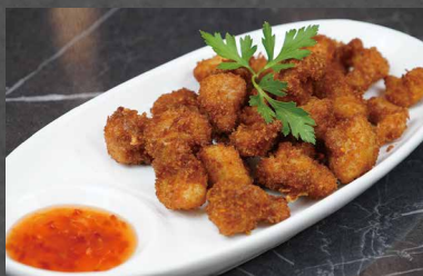
251 - POLLO FRITTO pollo, farina 🌾