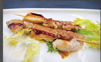
265 - SPIEDINI DI POLLO pollo, teriyaki