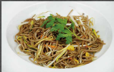
220 - SOBA CON VERDURE

verdura, uova, gamberi, cipollina, burro