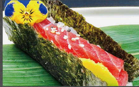
087 - TEMAKI MAGURO tonno, avocado, alghe, sesamo 🐟