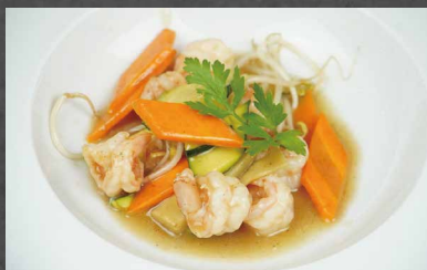
229 - GAMBERI CON VERDURE