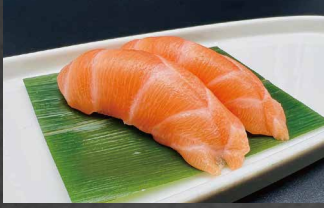
001 - NIGIRI SAKÉ salmone, riso 🍣