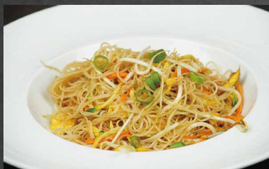
218 - SPAGHETTI RISO CON VERDURE