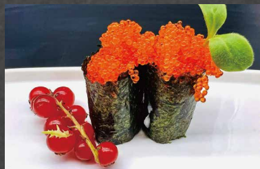
018 - GUNKAN TOBIKO uova di pesce, alghe, riso 🍣